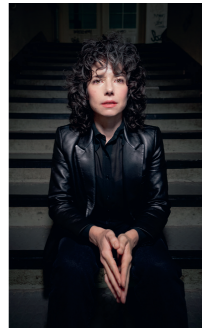
Abbildungen: Sebastian Schwamm, Stable Diffusion